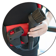
Un ceinture de hanche pour les accessoires

Le nouveau design mince et ergonomique offre un grand confort de transport. Le harnais est respirant, réglable, corrige la posture et dispose d'une ceinture de hanche dans laquelle les accessoires les plus utilisés peuvent être portés. La commande manuelle intégrée offre au RSV150 un confort d'utilisation optimal.