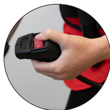
Opération manuelle intégrée